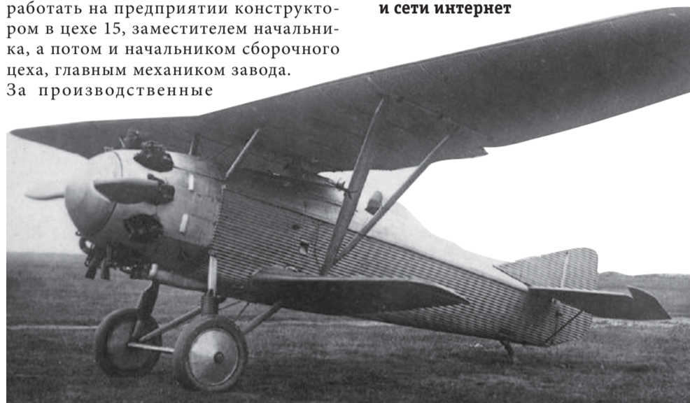
В годы войны предприятие выпускало выливные авиационные приборы типа ВАП-6М, ВАП-100, ВАП-500 и ленты-расчалки для оснащения самолётов фронтовой авиации, бомбардировщиков

Владимир Семашкин